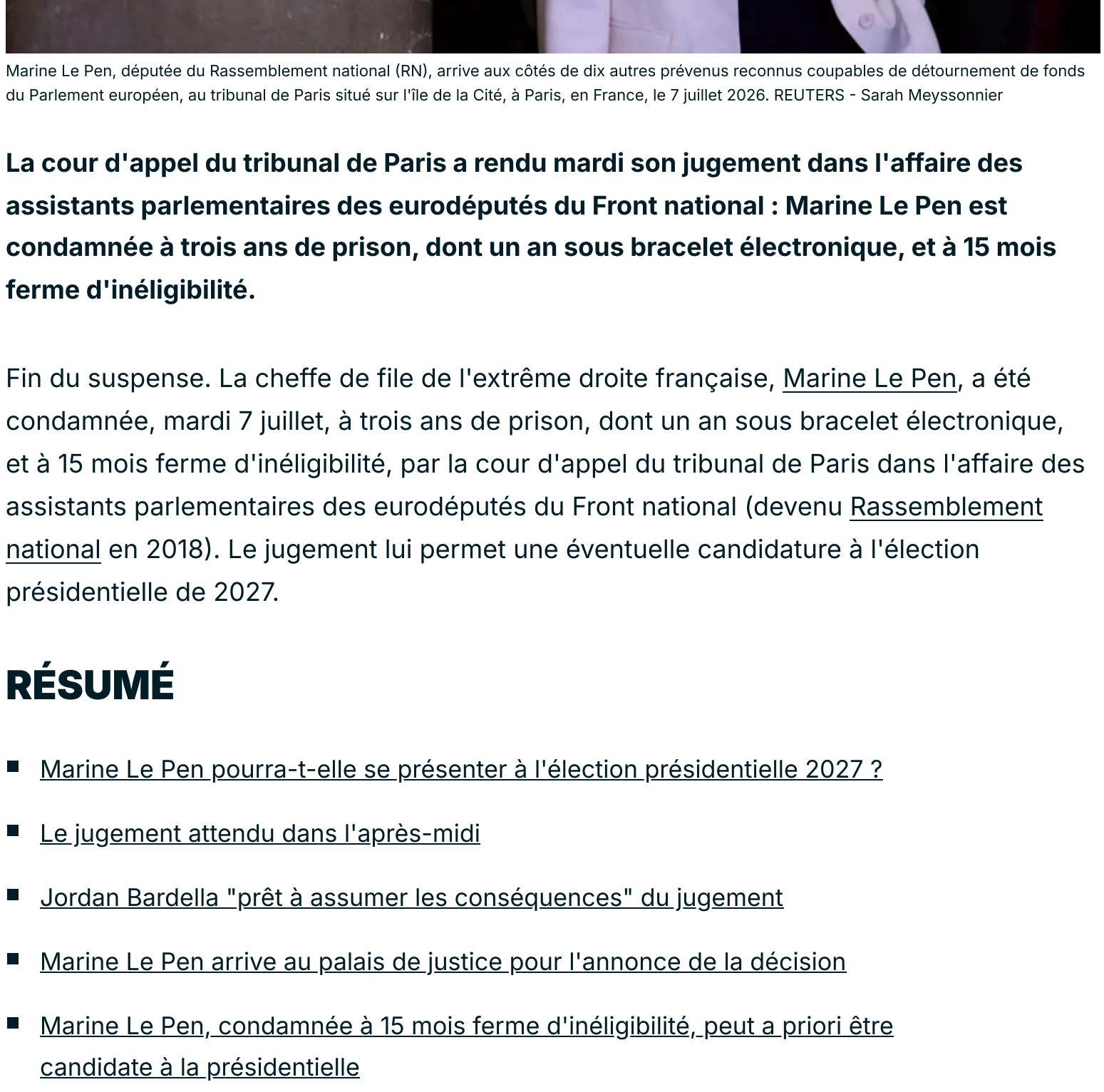
Marine Le Pen, députée du Rassemblement national (RN), arrive aux côtés de dix autres prévenus reconnus coupables de détournement de fonds du Parlement européen, au tribunal de Paris situé sur l'île de la Cité, à Paris, en France, le 7 juillet 2026.

La cour d'appel du tribunal de Paris a rendu mardi son jugement dans l'affaire des assistants parlementaires des eurodéputés du Front national : Marine Le Pen est condamnée à trois ans de prison, dont un an sous bracelet électronique, et à 15 mois ferme d'inéligibilité.