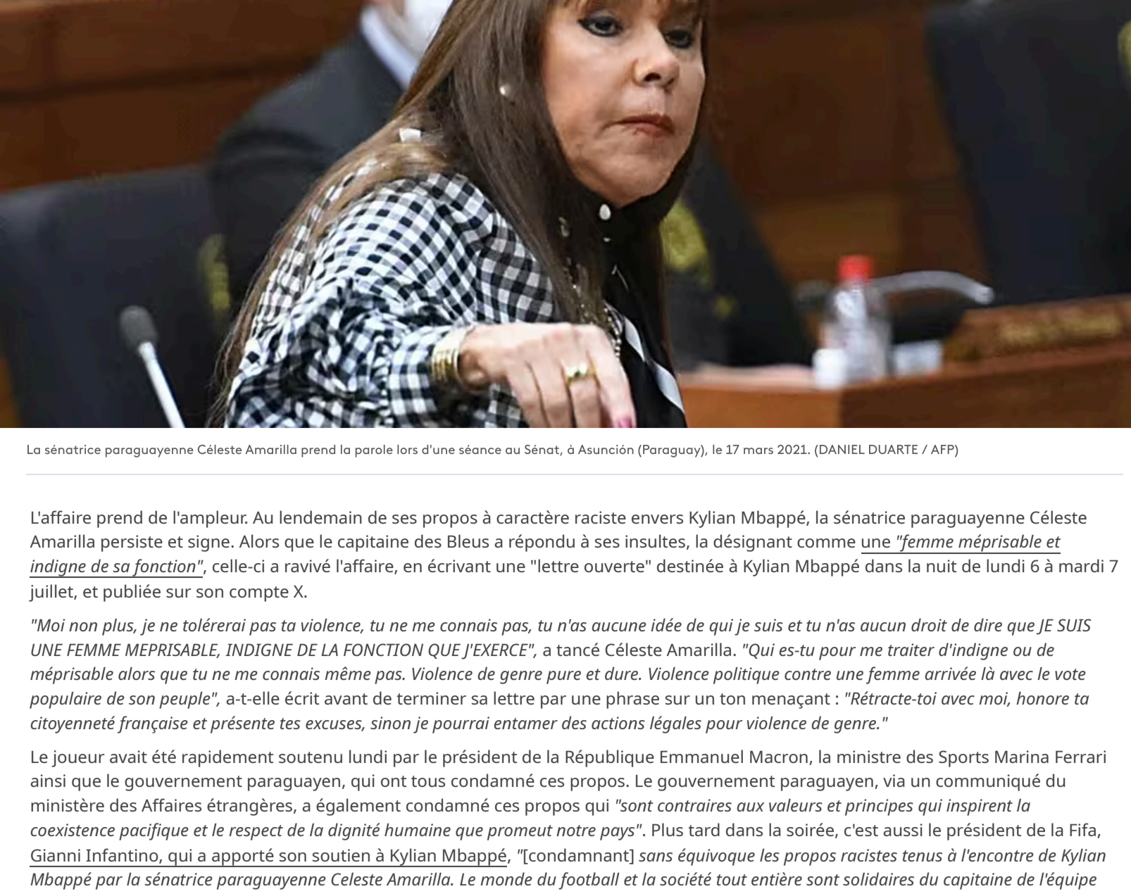
La sénatrice paraguayenne Céleste Amarilla prend la parole lors d'une séance au Sénat, à Asunción (Paraguay), le 17 mars 2021.

Publié le 07/07/2026 08:37 Mis à jour le 07/07/2026 09:21 Temps de lecture : 3min