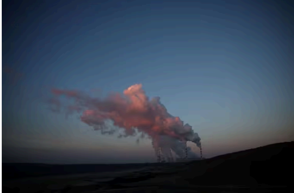
De la fumée et de la vapeur s'échappent de la centrale électrique de Belchatow, la plus grande centrale à charbon d'Europe alimentée au lignite, exploitée par la compagnie d'électricité polonaise PGE, à Kleszczow

La Commission européenne va proposer d'assouplir son système d'échange de quotas d'émission de gaz à effet de serre pour les entreprises industrielles en leur accordant davantage de quotas gratuits en échange d'investissements dans la décarbonation, a déclaré mercredi un responsable de l'institution.