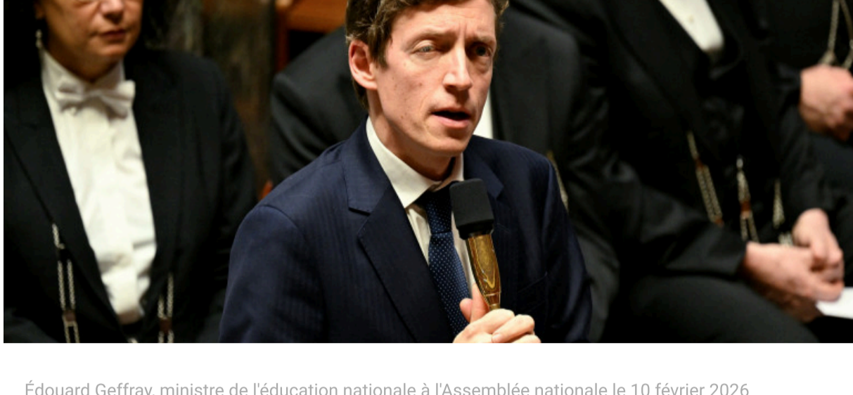
Édouard Geffray, ministre de l'éducation nationale à l'Assemblée nationale le 10 février 2026

24.000 personnes ont été admises aux concours d'enseignants cette année contre 16.000 l'année dernière, d'après le ministre de l'Éducation nationale Édouard Geffray.